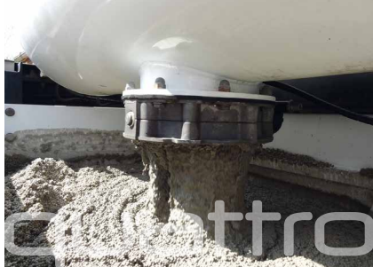
De Bremat S3.17 XL Quattro kan ook ingezet worden voor de productie van een hoogwaardige dikvloeiende EPS-mortel.