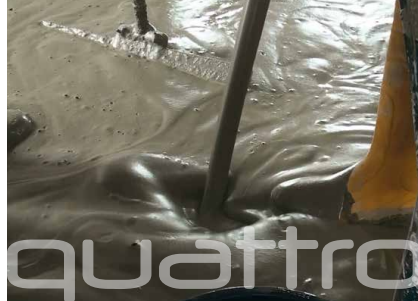
Bij de Quattro uitvoering kan een schuimgenerator schuim produceren en in de vloeiende mortel injecteren om zo schuimmortel te produceren.