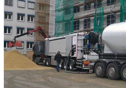
Door het horizontale productiesysteem kan de installatie tijdens het productieproces bijgeladen worden.