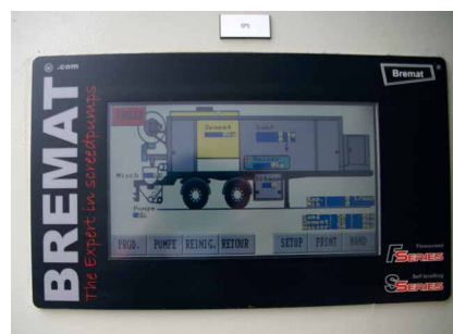
Het computergestuurde systeem is eenvoudig te bedienen met het geavanceerde touchscreen display.

Door het zelfstandig verzorgen van materiaaltransport, het afnemen van basis-materiaal in bulk en het volautomatisch vullen van de menger kan aanzienlijk op materiaal- en loonkosten worden bespaard. Daarnaast zorgt de S-serie voor een aanmerkelijke verbetering van de arbeidsomstandigheden.