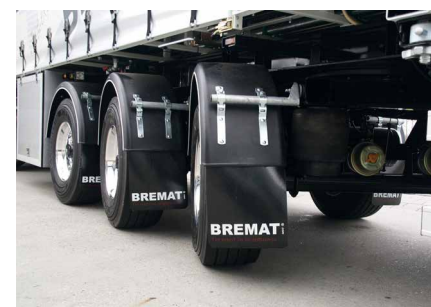
Het drie-assige opleggerchassis voldoet aan de meest recente veiligheids- en kwaliteitseisen en is tevens voorzien van een Europese Typegoedkeuring.