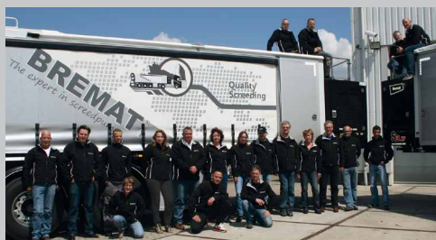
We staan graag voor u klaar om de beste machines te produceren én optimale service te verlenen!

Daarnaast levert Bremat ook klantspecifieke oplossingen voor het mengen en verpompen van allerlei morteltypes zoals EPS isolatiemortel, schuimmortel en PUR-materiaal.