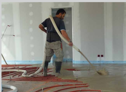
De preciese materiaaldosering garandeert de productie van een homogene en kwalitatief hoogwaardige vloermortel.

De Quattro uitvoering van de BreMAT S3.17 XL kan naast anhydriet en cement gebonden vloermortel ook EPS isolatiemortel en schuimmortel produceren. Zo is deze installatie geschikt voor het produceren van diverse vloerapplicaties.